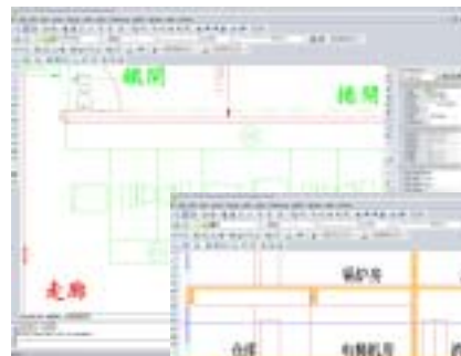
繁體簡體編碼自動轉換